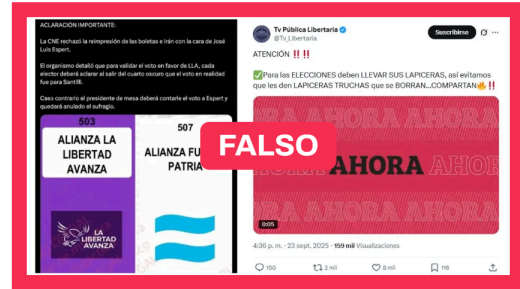
Boleta Única de Papel: estas son las noticias falsas que circulan en las elecciones 2025 sobre el nuevo sistema de votación