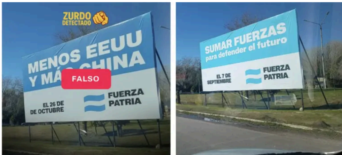
A la izquierda la imagen manipulada, a la derecha el cartel original de Fuerza Patria.

Este tipo de desinformaciones sobre falsas propuestas son comunes en períodos electorales y ya circularon en Argentina y en otros países de la región, como explica este reporte de Chequeado.