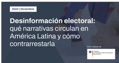
Desinformación electoral: qué narrativas circulan en América Latina y cómo contrarrestarla