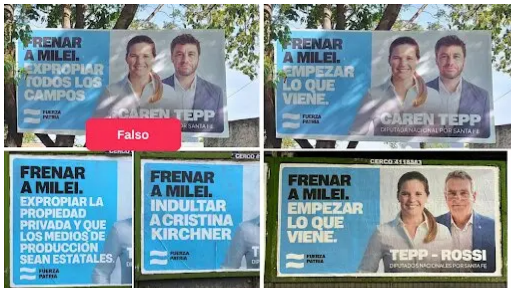
A la izquierda las imágenes manipuladas de Fuerza Patria en Santa Fe, a la derecha los carteles originales.