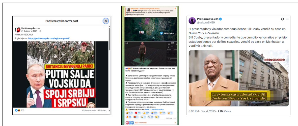
Ejemplos de publicaciones detectadas en la región