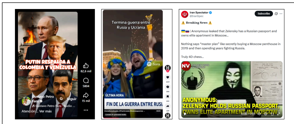
Ejemplos de publicaciones detectadas en la región

Un canal de Telegram llamado Venezuela News , perteneciente a un sitio web venezolano que comparte regularmente desinformación prorrusa y que cuenta con más de 56.000 seguidores, publicó un artículo que afirmaba que un soldado ucraniano de 23 años estaba llorando tras haber sido reclutado por la fuerza. Este mismo artículo también fue compartido en X por varias cuentas con la marca azul Premium de la plataforma y circuló en varios países.