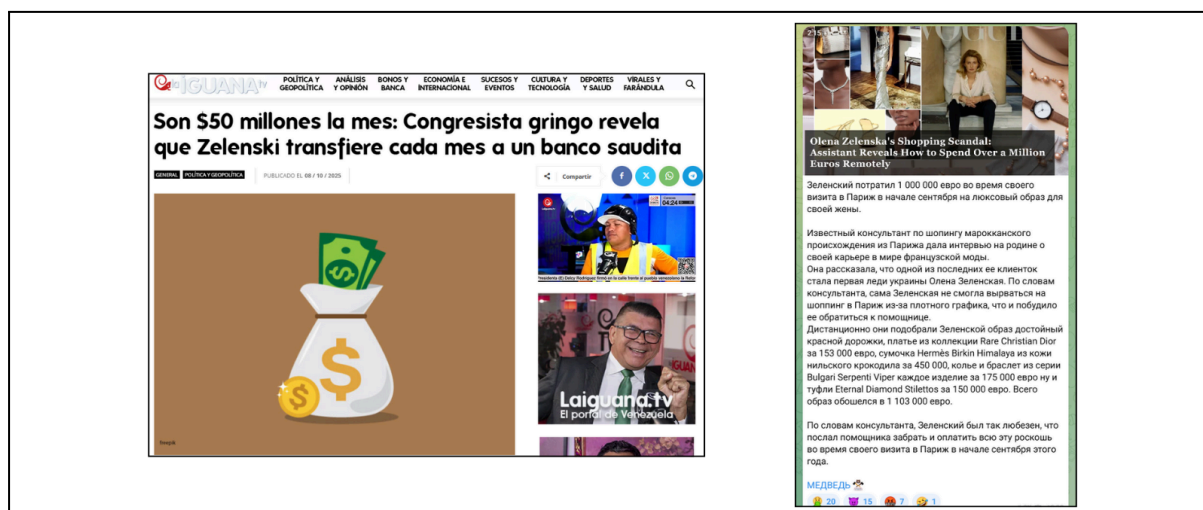
Ejemplos de publicaciones detectadas apoyando esta narrativa